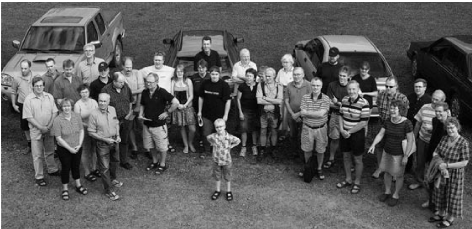
Mötet den 11 augusti samlade, trots det fina sommarvädret, cirka 40 deltagare. Några av dem ser du på bilden.

Dokumentationen syftar till att ha jämförelse-material när Vattenfall och övriga entreprenörer